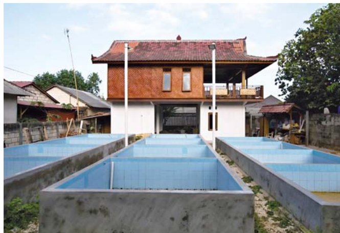
Bazény pro želvy a obytná budova.