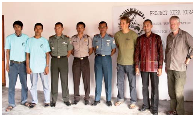
Slavností otevření s místní generalitou v roce 2009 (licence a plný provoz však díky byrokracií až v roce 2014).