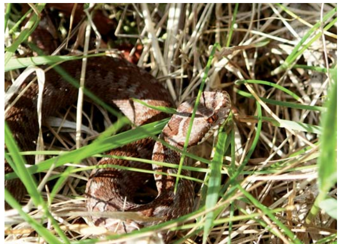
Mládě zmijsky obecné. Lokalita Lom Hřebečná v Krušných horách.