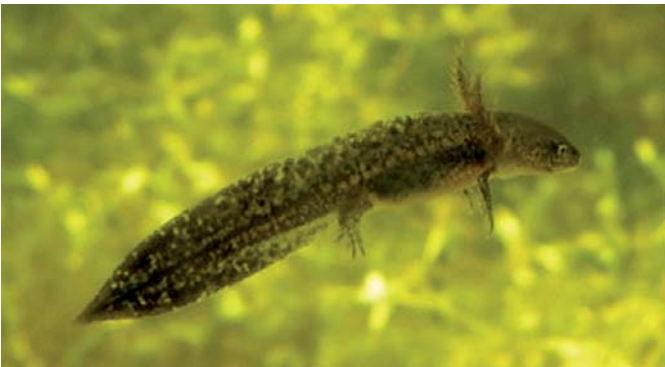
Vajíčko čolka horského (v pozadí vajíčka plovatky bahenní, foto: Marcela Lazurková), larva (foto: Martin Šandera), samice na souši, samec ve vodní fázi (foto: Marcela Lazurková) a svlečená svrchní vrstva pokožky (foto: Martin Šandera). Lokalita: Muzeum přírody Český ráj, Prachov.