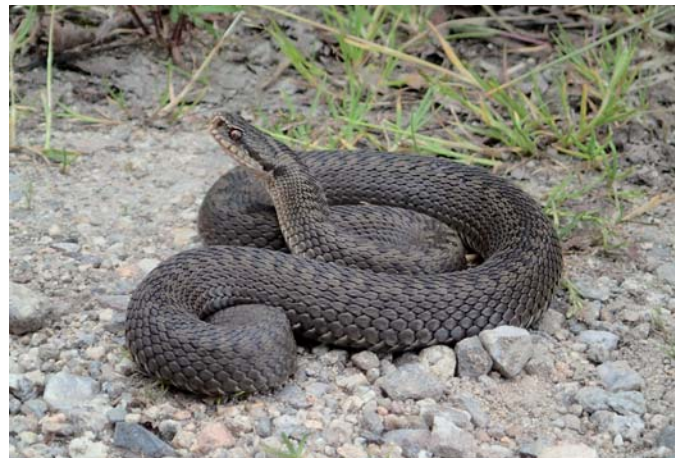
Samice zmijsky obecné. Lokalita Bludná v Krušných horách.