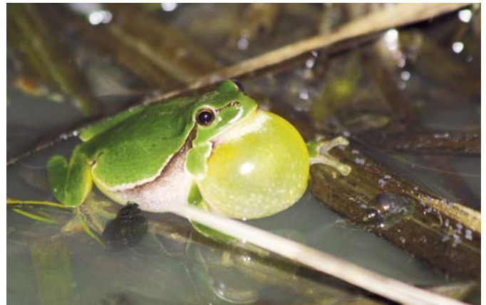
Samec rosničky zelené.

Nechť je básnička inspirací pro vás. Zkuste složit krátkou básničku o rosničce zelené nebo ještěrce zelené a poslat e-mailem na m.sandera@seznam.cz . Hezké básničky otiskneme v dalších číslech časopisu Pulec a nejlepší odměníme.