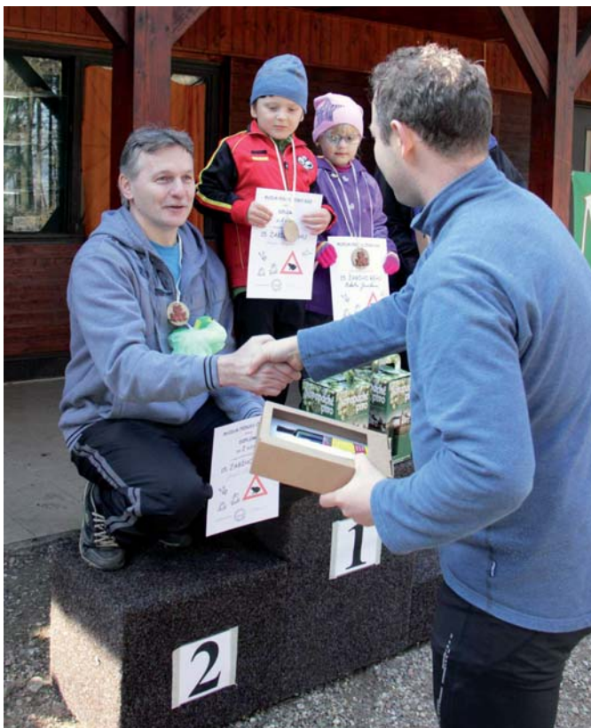
Můžete běžet, jít a nebo si dát i pauzu... S žabím doplňkem je to pak navíc v cíli ohodnoceno.