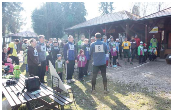
Okamžiky před startem loňského jarního Žabího běhu v Prachově, který se konal 8. března 2015 října.