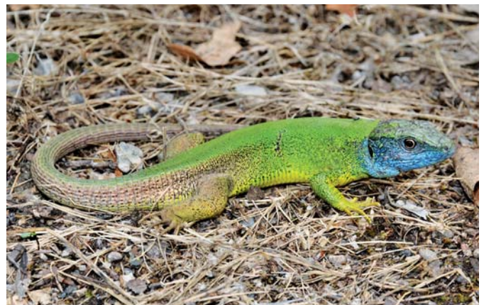
Samec ještěrky zelené.

Mapa rozšíření rosničky zelené v České republice. Rosnička se vyskytuje mozaikovitě, převážně v nižších a středních polohách na dobře osluněných lokalitách.