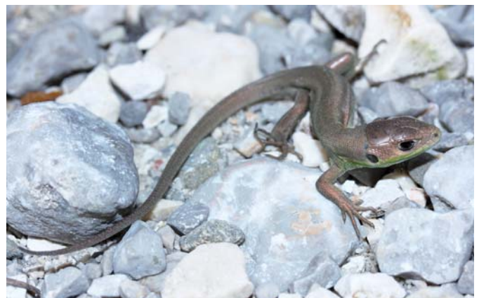
Mládě ještěrky zelené.